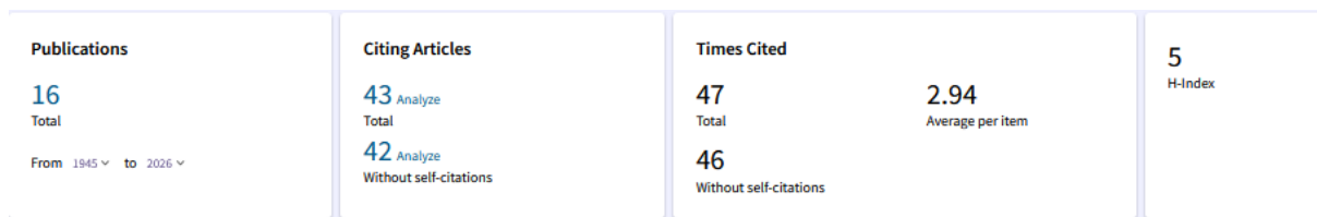
Times Cited and Publications Over Time

* Jeden udělený patent nahrazuje 5 publikací Scopus/WoS, 2 publikace s IF a 3 citace dle WoS bez autocitací. V případě aplikované matematiky se u hlavního autora vyžaduje min. 50% autorský podíl.